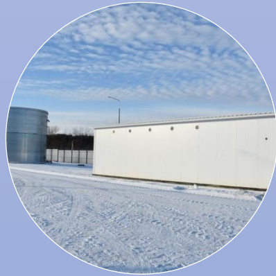
Водоснабжение и водоотведение