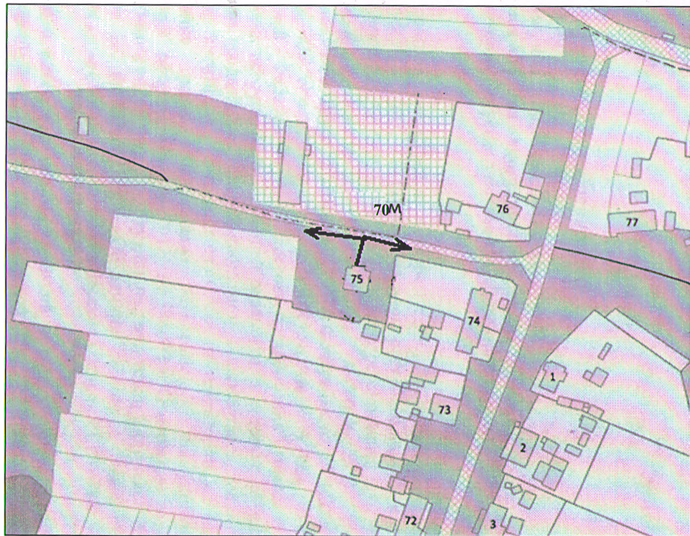
Калужская область Дзержинский район д. Бели, д. 75 Фельдшерско-акушерский пункт