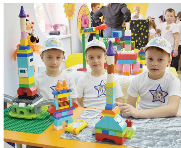
Команда «Звёздный десант» детского сада «Родничок».

Турнир по легоконструированию организован с целью развития детского технического творчества, выявления и поддержки одарённых детей, обладающих конструкторским мышлением.