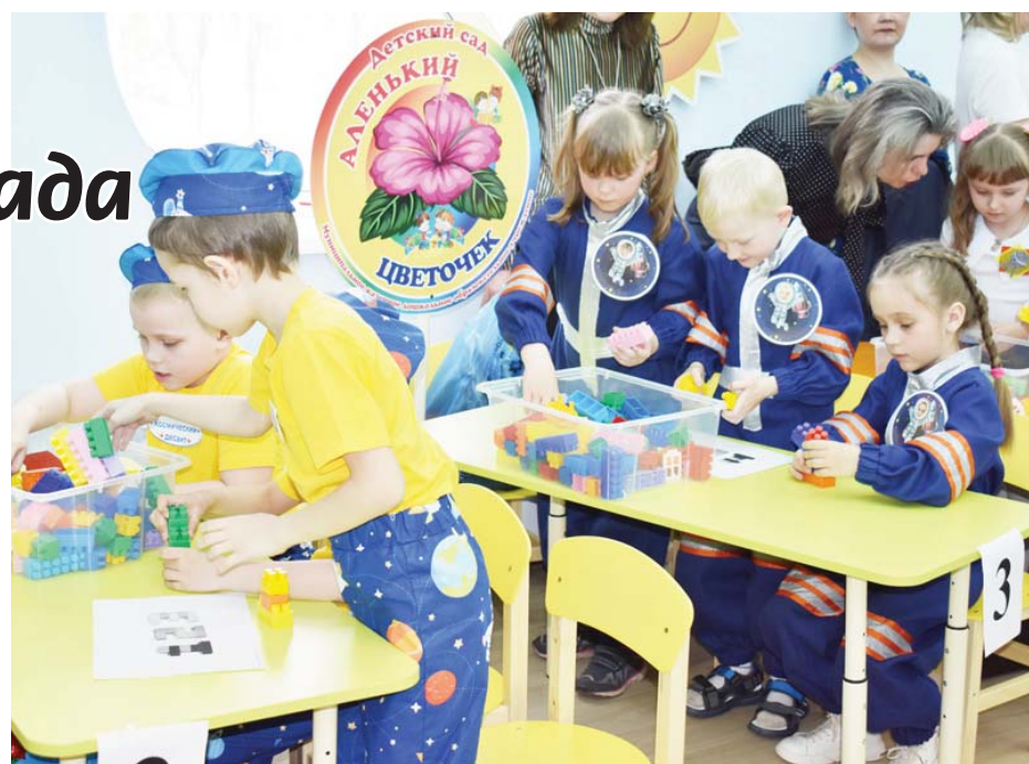
Самостоятельное выполнение технического задания.

Отдельное задание подготовили специально для лидеров команд. Успешно справившись в этом туре, ребята показали, что многому научились в детском саду. Умеют сосредоточить-