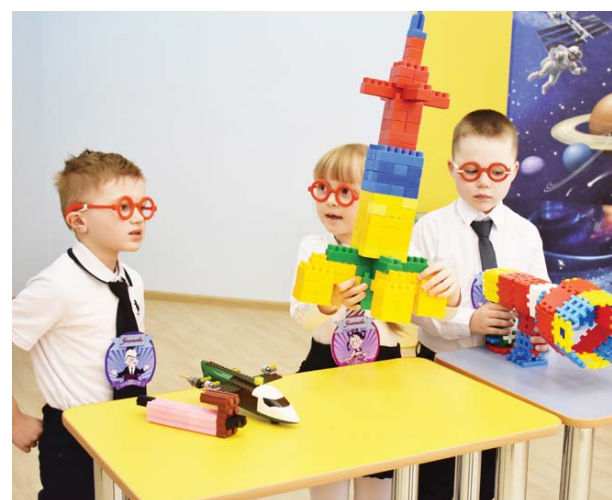
«Знайки» из детского сада «Улыбка» стали лауреатами турнира.