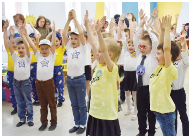
«Космическая» зарядка между конкурсами.

13 апреля в городе Кондрово прошёл районный конкурс по легоконструированию для дошкольников, посвящённый 60-летию полёта Юрия ГАГАРИНА.