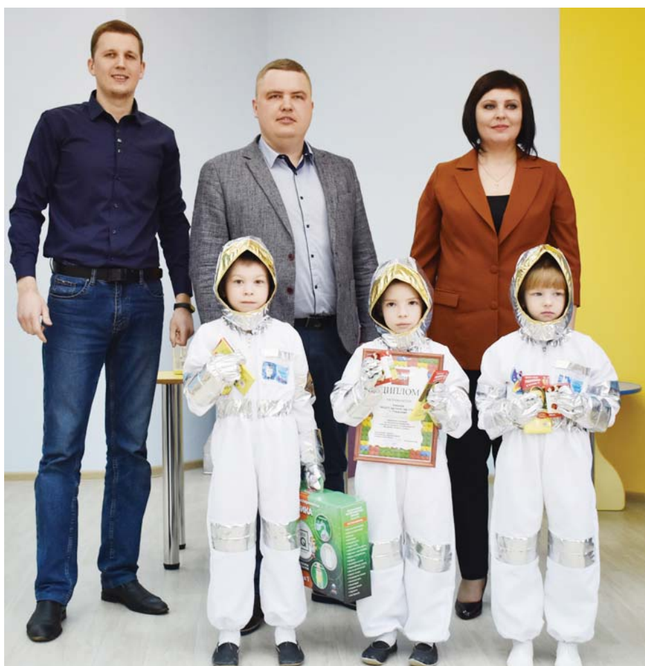
Победитель районного конкурса по легоконструированию – команда детского сада «Умка». Фото на память с судейской бригадой.

Турнир по легоконструированию организован с целью развития детского технического творчества, выявления и поддержки одарённых детей, обладающих конструкторским мышлением.